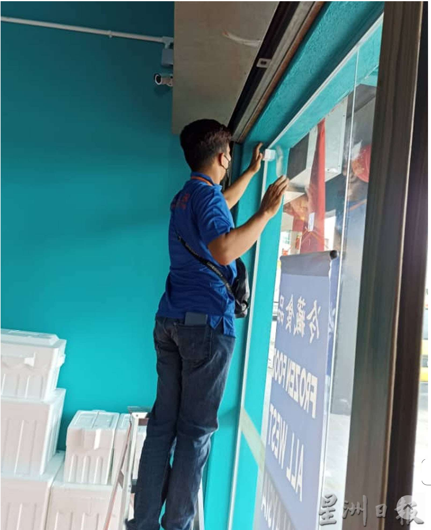
曼绒市议会自11月10日开至12月8日，已为近4000名商家安装“电子执照”。