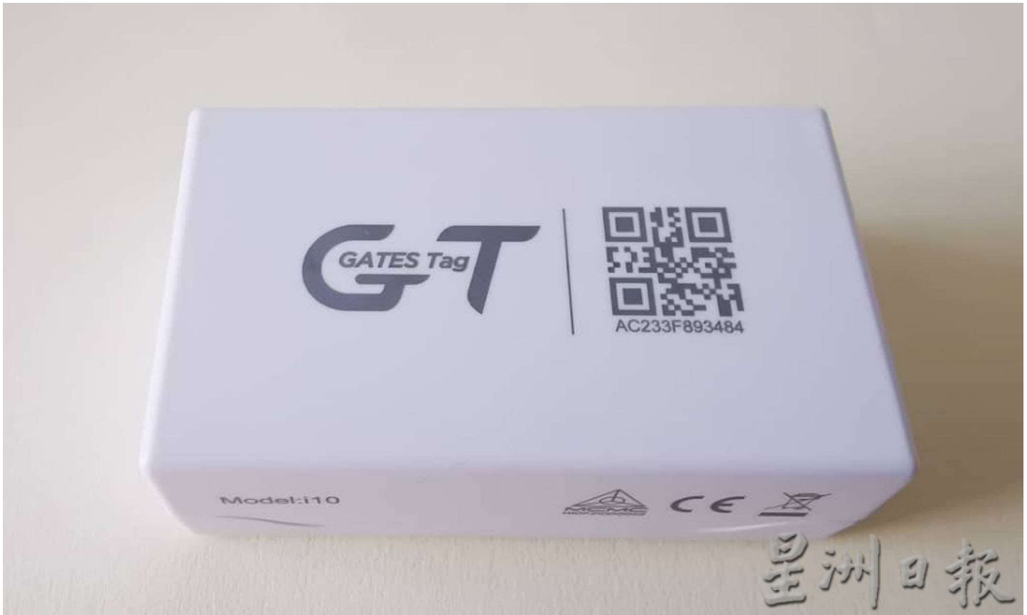
名为MYPATIL的智能感应器（电子执照），取代传统的纸张执照。