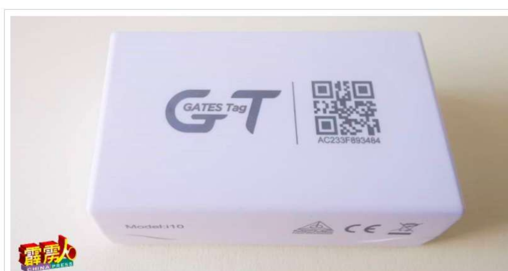
电子商业执照myPATIL智能感应器。