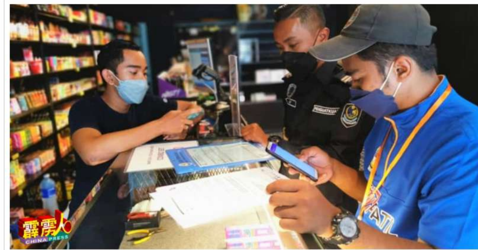
曼绒市议会鼓励商家申办及更新商业执照, 使用电子商业执照myPATIL。

“同时, 该电子商业执照感应器也具有信用卡付费、电子银行转帐 (FPX) 及电子钱包付费的功能, 甚至可于日后在myMANJUNG平台打广告, 使用数码营销便利。”