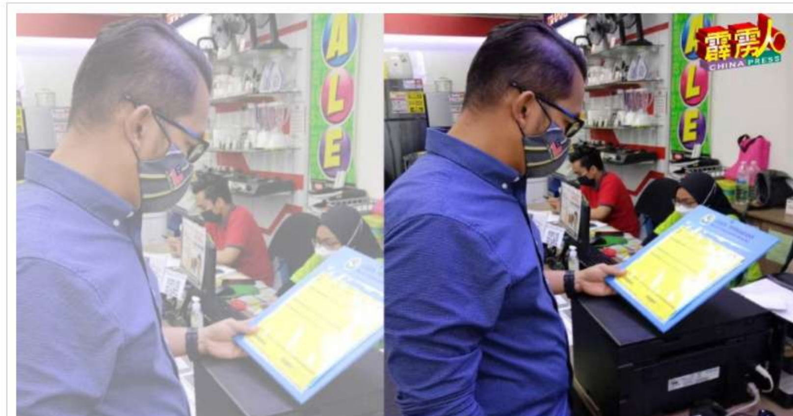
沙里尔指传统式印刷版的商业执照将被淘汰。

他呼吁还未申办或未更新商业执照的商家, 于2021年12月31日前申办, 曼绒市议会暂不会对付。