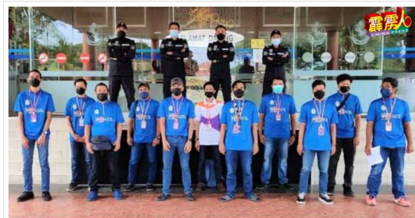
myPATIL特工队将身穿制服, 于工作时间为商家安装myPATIL智能感应器。