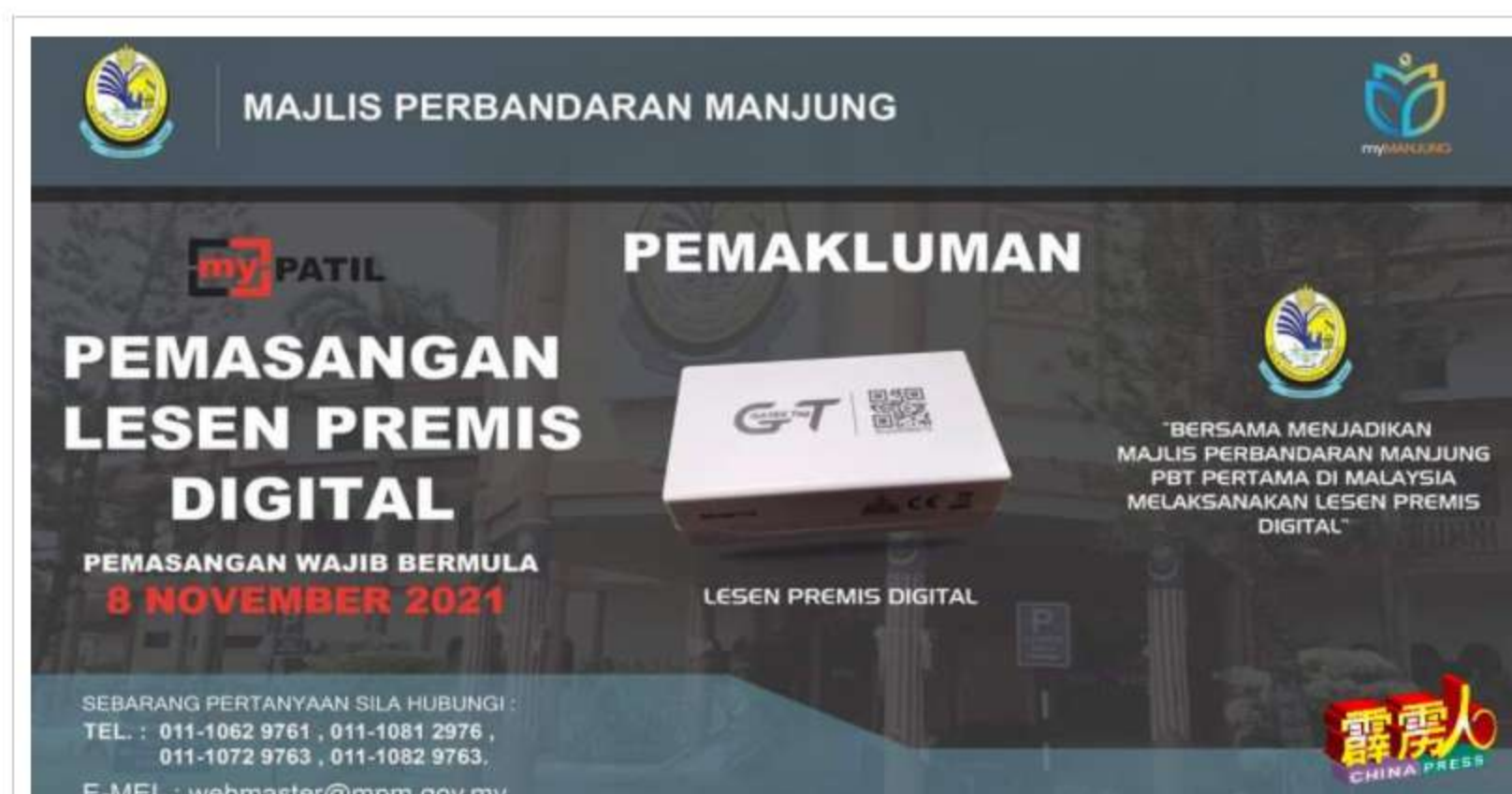
曼绒市议会于11月8日开始, 强制性为地方上商家安装myPATIL智能感应器。

“因此, 特工队已于11月8日开始, 为斯里曼绒和实兆远区持有曼绒市议会商业执照的商家, 在店内安装电子商业执照智能感应器, 而感应器和安装费用皆由曼绒市议会承担, 要强调的是, 该感应器不是针孔摄影机或窃听器, 民众无须担心。”